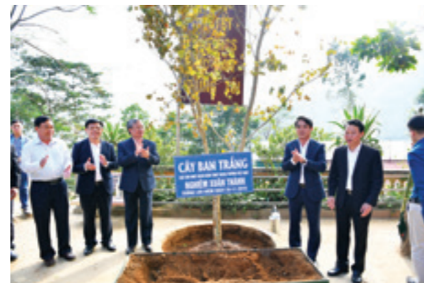
Ông Trần Quốc Vượng - Ủy viên Bộ Chính trị, Thường trực Ban bí thư (thứ 3 từ trái sang) cùng lãnh đạo tỉnh Yên Bái, Vietcombank và huyện Trạm Tấu trồng cây lưu niệm tại Trường Phổ thông dân tộc bán trú TH & THCS Túc Đán

Trong những năm gần đây, hằng năm, Vietcombank dành cho hoạt động ASXH khoảng 200 tỷ đồng, chủ yếu là lĩnh vực giáo dục và y tế. Tại tỉnh Yên Bái, mặc dù chưa có sự hiện diện của chi nhánh Vietcombank nhưng Vietcombank cũng đã tài trợ vào một số công trình liên quan đến y tế và giáo dục của tỉnh. Trước Tết Nguyên đán 2018, nhân dịp được cùng tham gia đoàn công tác của đồng chí Thường trực Ban bí thư thăm và chúc Tết đồng bào tỉnh Yên Bái, Vietcombank đã tiếp cận và vinh dự tài trợ 02 trường của hai huyện vùng cao khó khăn là Trạm Tấu và Mù Cang Chải với tổng trị giá 6 tỷ đồng.