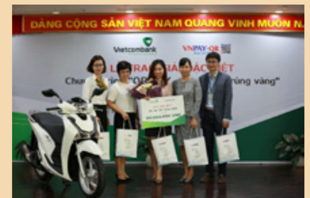
Đại diện các đơn vị VNPAY, Vietcombank, Hồng Lam trao thưởng cho khách hàng may mắn nhất của chương trình