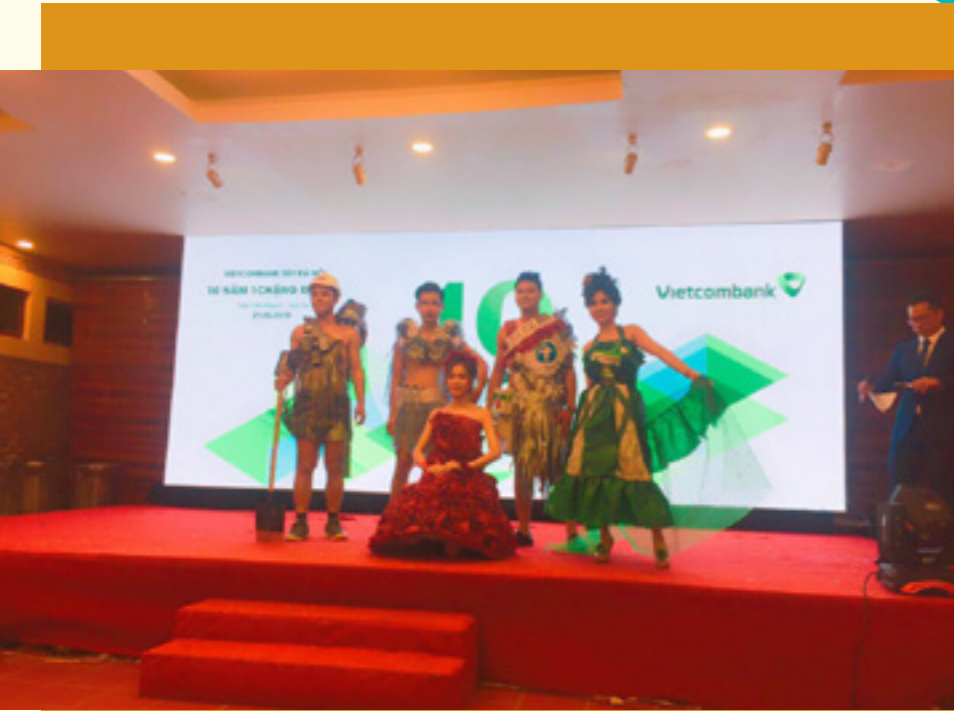
Bộ sưu tập Người con gái Vietcombank cùng chặng đường 10 năm Vietcombank Chi nhánh Tây Hà Nội