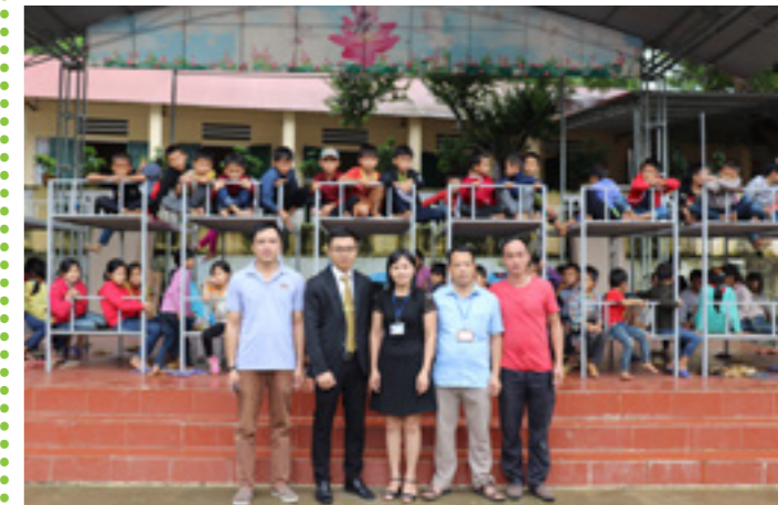
Đại diện Vietcombank Tuyên Quang chụp ảnh lưu niệm cùng giáo viên, học sinh điểm Trường Phổ thông dân tộc bán trú tiểu học Bạch Ngọc

Với chương trình an sinh xã hội này, Chi nhánh Vietcombank Tuyên Quang đã để lại nhiều ấn tượng tốt đẹp trong lòng người dân địa phương vùng cao tỉnh Hà Giang. Chi nhánh Vietcombank Tuyên Quang luôn mong muốn đồng hành cùng cộng đồng, chia sẻ khó khăn đặc biệt những vùng còn nhiều thiếu thốn.