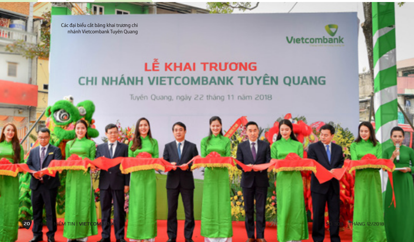
Các đại biểu cắt băng khai trương chi nhánh Vietcombank Tuyên Quang