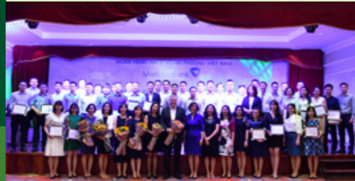
Lãnh đạo Vietcombank, VCLI cùng các tập thể và cá nhân đạt giải chụp hình lưu niệm