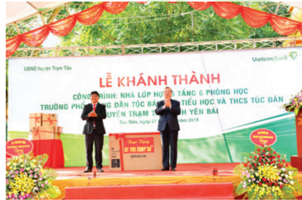
Ông Trần Quốc Vượng - Ủy viên Bộ Chính trị, Thường trực Ban bí thư (bên phải) trao tặng trường Trường phổ thông dân tộc bán trú TH&THCS xã Túc Đán 01 ti vi 50 inch

“Với một công trình khang trang được xây dựng và đưa vào sử dụng, phong trào dạy và học của trường sẽ được tốt hơn, các cháu sẽ là những con ngoan trò giỏi để hôm nay chúng em tự hào về trường, ngày mai nhà trường tự hào về các em” - ông Nguyễn Xuân Thành chia sẻ.