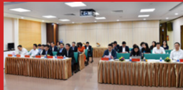
Các đại biểu thuộc Đảng bộ Ngân hàng TMCP Ngoại thương Việt Nam tham dự Hội nghị tại điểm cầu thuộc Trụ sở chính Vietcombank