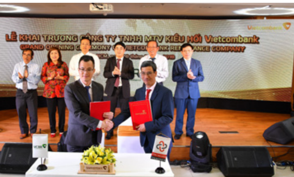
VCBR và TNMonex ký kết thỏa thuận hợp tác

ngân hàng tại Việt Nam, với sự đảm bảo về chất lượng dịch vụ.