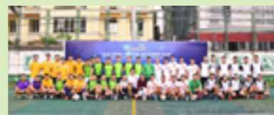
Ban tổ chức chụp ảnh lưu niệm cùng các đội tham dự Giải bóng đá TSC Vietcombank 2018

BTC đã thay mặt các đội bóng gửi lời cảm ơn đến Ban lãnh đạo, Ban chấp hành công đoàn TSC đã tạo ra một sân chơi bổ ích, giúp các đoàn viên công đoàn tại các Phòng/Ban/Trung tâm tại TSC có cơ hội đc giao lưu, học hỏi nhằm