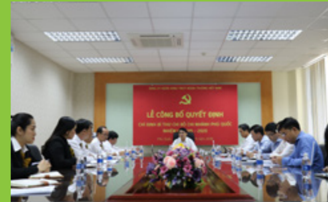
Lễ công bố Quyết định chỉ định Bí thư Chi bộ và chỉ đạo hoạt động kinh doanh tại Vietcombank CN Phú Quốc

S áng ngày 02/11/2018, tại Trụ sở CN Vietcombank Phú Quốc đã diễn ra Lễ công bố Quyết định chỉ định Bí thư Chi bộ CN Phú Quốc nhiệm kỳ 2015 - 2020.