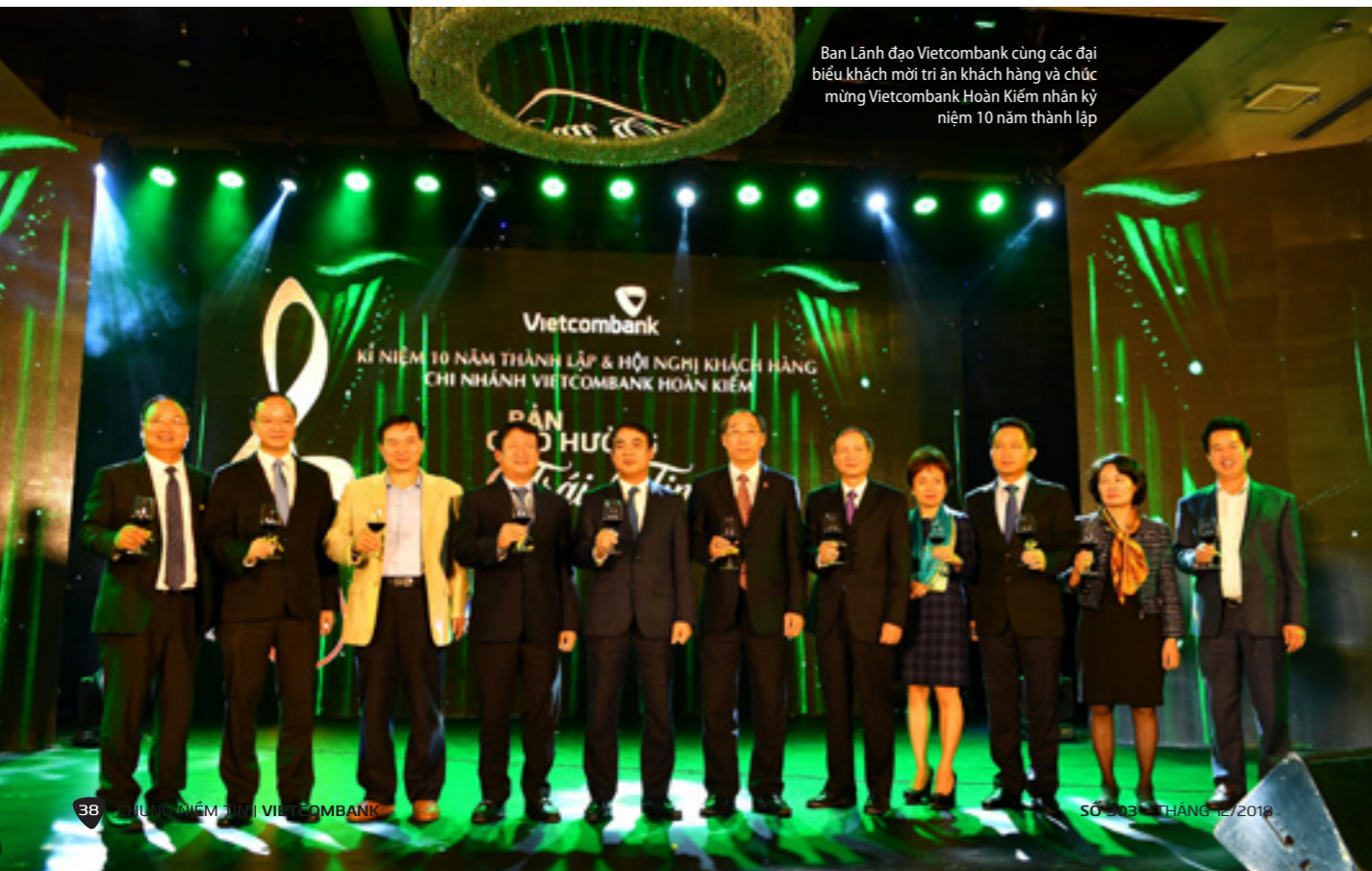
Ban Lãnh đạo Vietcombank cùng các đại biểu khách mời tri ân khách hàng và chúc mừng Vietcombank Hoàn Kiếm nhân kỷ niệm 10 năm thành lập

Trong khuôn khổ sự kiện, Vietcombank Hoàn Kiếm đã tổ chức nhiều chương trình, hoạt động thiết thực với mục đích nâng tầm mối quan hệ toàn diện giữa Vietcombank và khách hàng.