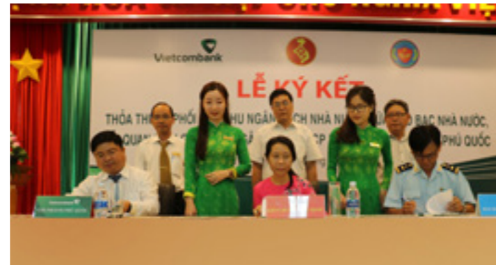
Lễ ký kết thỏa thuận hợp tác về tổ chức phối hợp thu NSNN

tăng cường tinh thần đoàn kết, tăng cường sức khỏe, tạo động lực hoàn thành các chỉ tiêu kế hoạch được giao.