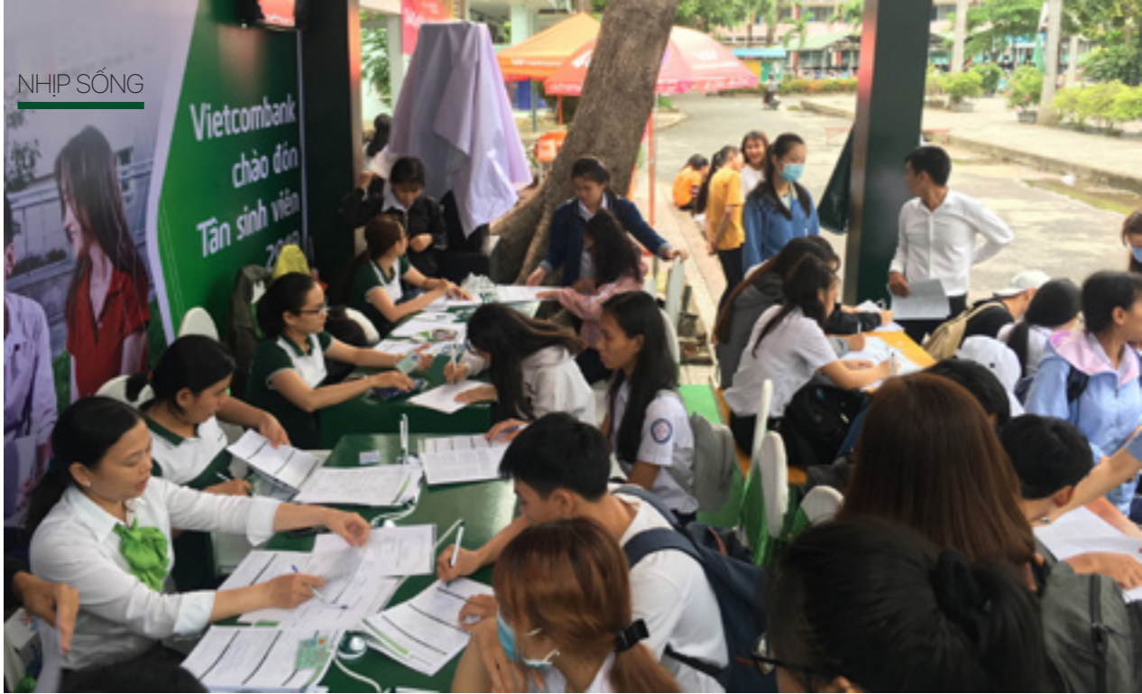
Cán bộ Vietcombank tư vấn các sản phẩm dịch vụ dành cho các bạn sinh viên