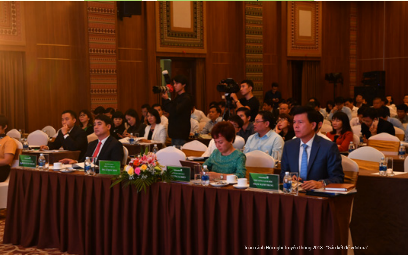
Toàn cảnh Hội nghị Truyền thông 2018 - “Gắn kết để vươn xa”