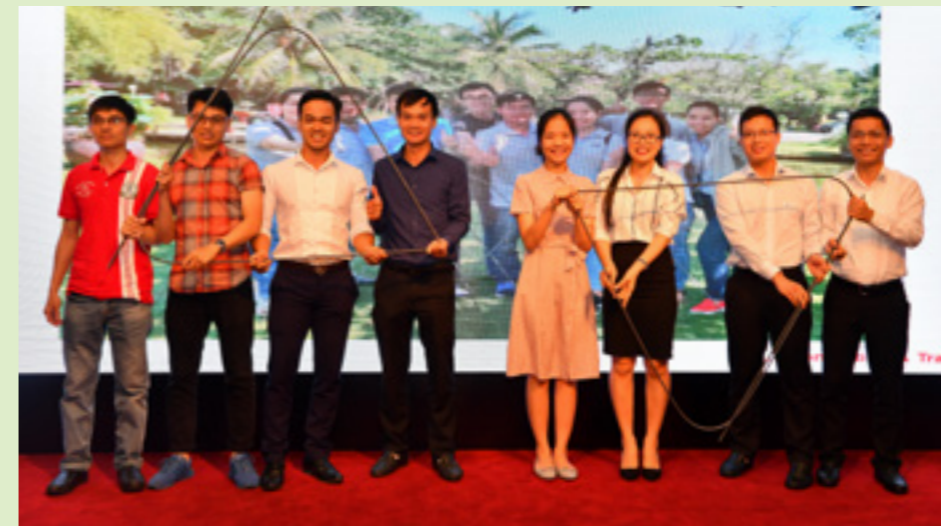
Các cán bộ trải nghiệm sử dụng sức khỏe và sự khéo léo bề cong thanh sắt uốn thành logo Vietcombank