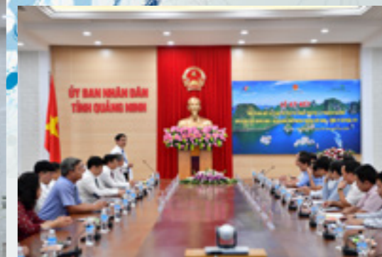
Ông Nghiêm Xuân Thành - Chủ tịch HĐQT Vietcombank phát biểu tại buổi lễ