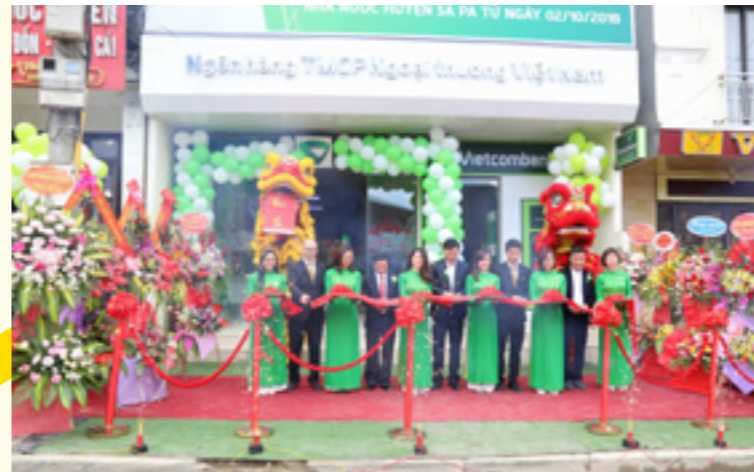
Các đại biểu cắt băng khai trương PGD Sa Pa

Và thiết kế “con cưng” cuối cùng trong BST ấn tượng này chính là bộ váy dạ tiệc quyến rũ với tên gọi “999 đóa hồng”. Sự vận dụng tinh tế, đầy sáng tạo của Nhóm thiết kế khi hô biến những mảnh giấy màu thành những bông hoa tươi thắm, tỏa sáng trên sân khấu. Trên tông nền đỏ, những cánh hoa mạnh mẽ, khỏe khoắn nhưng cũng không kém phần kiêu sa, duyên dáng như làm đủ đầy hơn nét đẹp của người con gái Vietcombank. Bộ trang phục như một lời tôn vinh phái đẹp, 999 đóa hồng như một món quà, một lời chúc thân thương và tốt đẹp nhất gửi tặng tới một nửa thế giới.