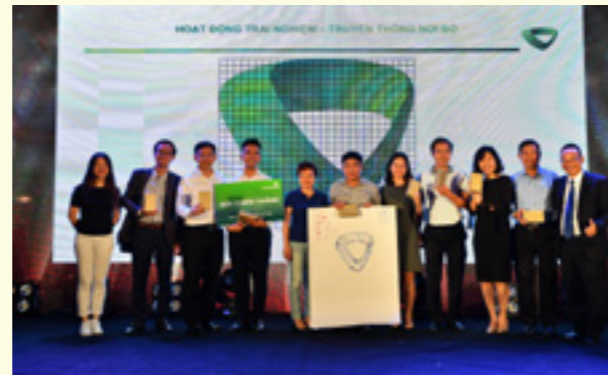
Khởi động Dự án truyền thông nội bộ với hình ảnh thương hiệu Vietcombank