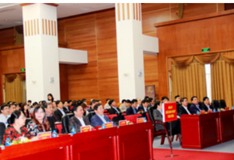
Đ/c Nghiêm Xuân Thành - Ủy viên BCH Đảng bộ Khối DNTW, Bí thư Đảng ủy, Chủ tịch HĐQT Vietcombank (hàng đầu, thứ 3 từ phải sang) tham dự Hội nghị tại điểm cầu chính của Đảng ủy Khối DNTW