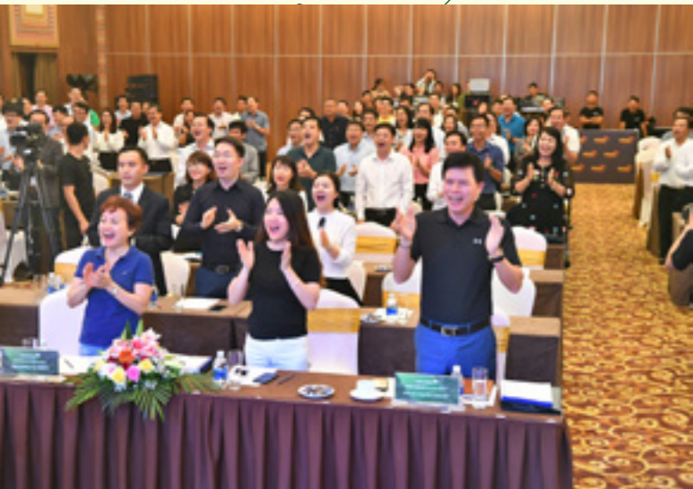
Hội nghị Khởi động Dự án truyền thông nội bộ

Vietcombank Hồ Chí Minh, Vietcombank Bình Dương và Vietcombank Hải Dương.