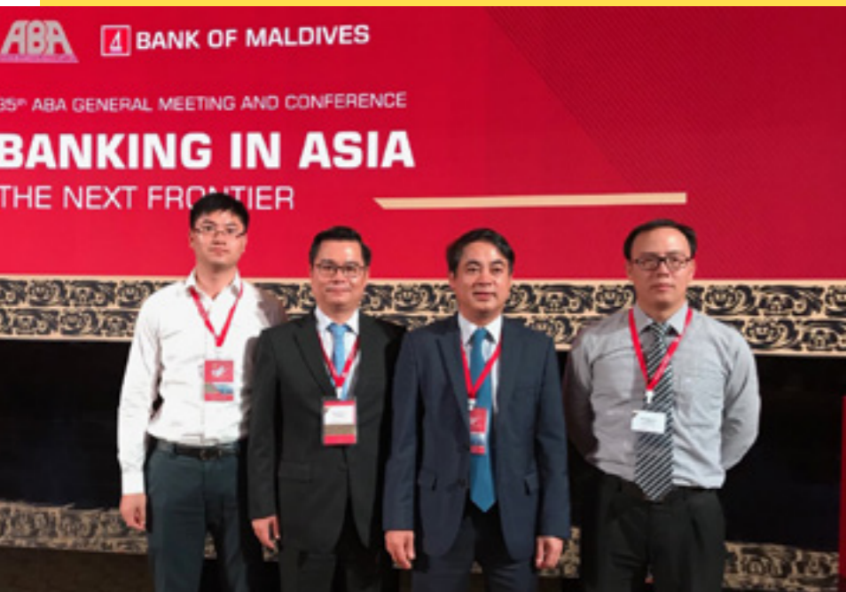
Đoàn đại biểu Vietcombank do Chủ tịch HĐQT Nghiêm Xuân Thành (thứ hai từ bên phải) dẫn đầu tham dự Hội nghị thường niên ABA lần thứ 35