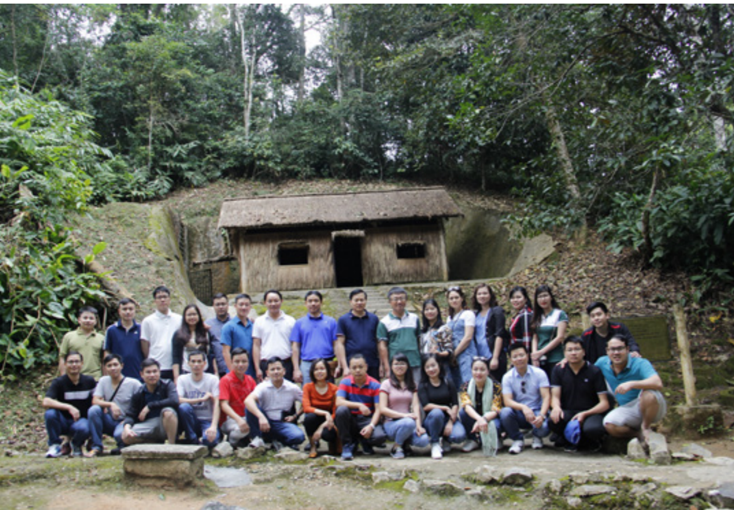
Đoàn công tác tới thăm sở chỉ huy chiến dịch điện biên phủ tại xã Mường Phăng, huyện Điện Biên