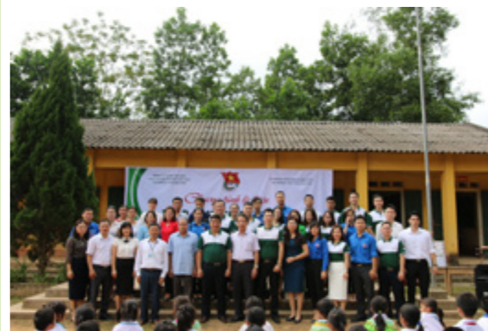
Đại biểu và đoàn viên thanh niên NHNN tỉnh Thái Nguyên và Vietcombank Thái Nguyên chụp ảnh lưu niệm cùng chương trình