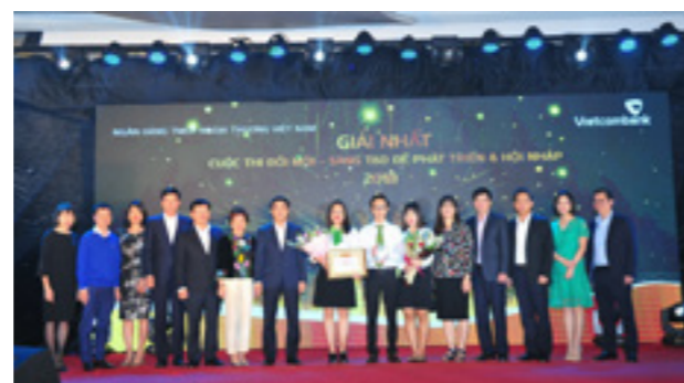
Hội đồng Giám khảo và các khách mời trao giải Nhất cho nhóm tác giả đến từ Trung tâm thanh toán - Trụ sở chính

Qua 1 ngày làm việc khẩn trương và hiệu quả, các tác giả/nhóm tác giả và Hội đồng Giám khảo đã hoàn thành toàn bộ chương trình của Vòng Chung khảo Cuộc thi và lựa chọn được 1 giải Nhất, 2 giải Nhì, 4 giải Ba và 13 giải Khuyến khích, trong đó giải Nhất đã thuộc về đội thi đến từ Trung tâm thanh toán - Trụ sở chính với sáng kiến “VCB-EasyBanking, số hóa không gian và thời gian giao dịch”.