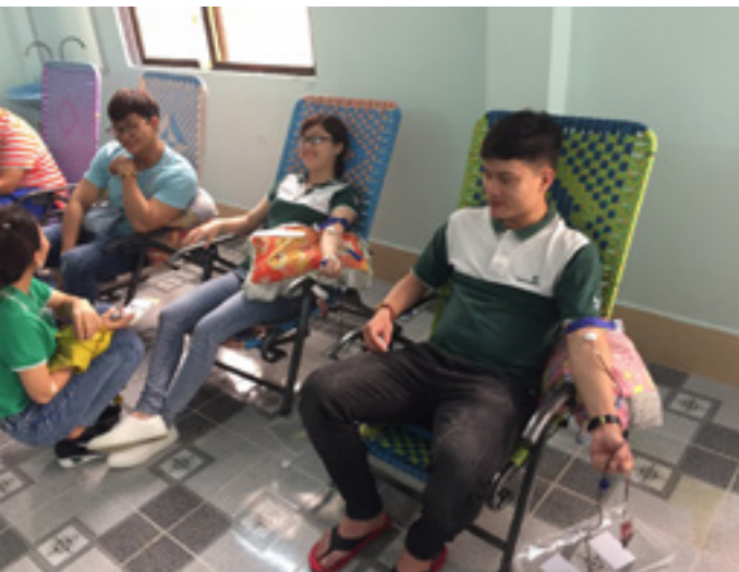
Niềm vui của các Đoàn viên Chi đoàn Vietcombank Kiên Giang khi tham gia hiến máu tình nguyện