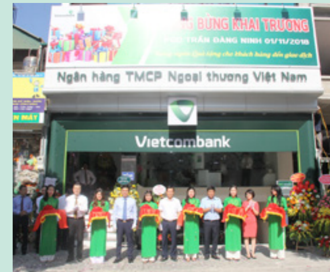
Đại diện chính quyền địa phương quận Cầu Giấy và Đại diện Ban lãnh đạo Vietcombank Thăng Long cắt băng khánh thành địa điểm giao dịch mới PGD Trần Đăng Ninh

Phòng giao dịch Trần Đăng Ninh trực thuộc Vietcombank Thăng Long tọa lạc ở vị trí đắc địa trên đường Trần Đăng Ninh, giao thông thuận tiện, được thiết kế theo chuẩn nhận diện thương hiệu mới của Vietcombank với đầy đủ cơ sở vật chất hiện đại, cung cấp đầy đủ các dịch vụ ngân hàng đến với mọi khách hàng.