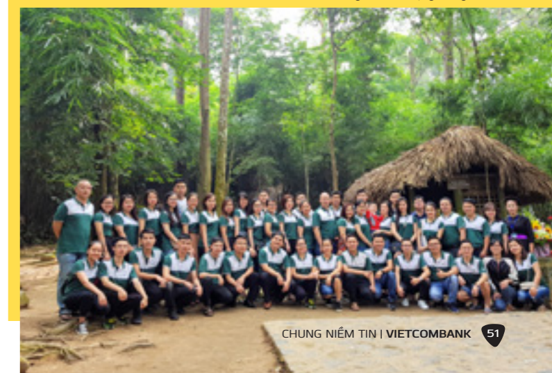
Lán Nà Lừa - nơi ở và làm việc của Bác Hồ những ngày chuẩn bị tổng khởi nghĩa Cách mạng tháng 8/1945

Hành trình về nguồn cũng là dịp để mỗi cán bộ trong chi nhánh Vietcombank Lào Cai nhìn lại những chặng đường đã qua, ôn lại truyền thống hào hùng của ngành Ngân hàng cũng như của dân tộc Việt Nam.