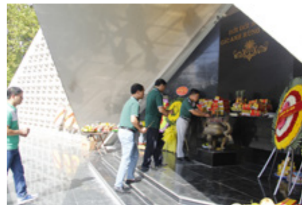
Cán bộ Vietcombank Bắc Giang thấp hương viếng các anh hùng liệt sỹ