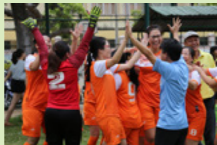
Giây phút thăng hoa ăn mừng chiến thắng của các nữ cầu thủ và cổ động viên

55 năm khởi nghiệp, VCB kinh bank thể thao, qua nhiều cung bậc quyết tâm xây dựng đất nước phồn vinh. Vạn nơi ngày tận biển, tàn huyết kinh doanh phát huy truyền thống tiến lên, VCB luôn vì lợi ích hàng đầu.