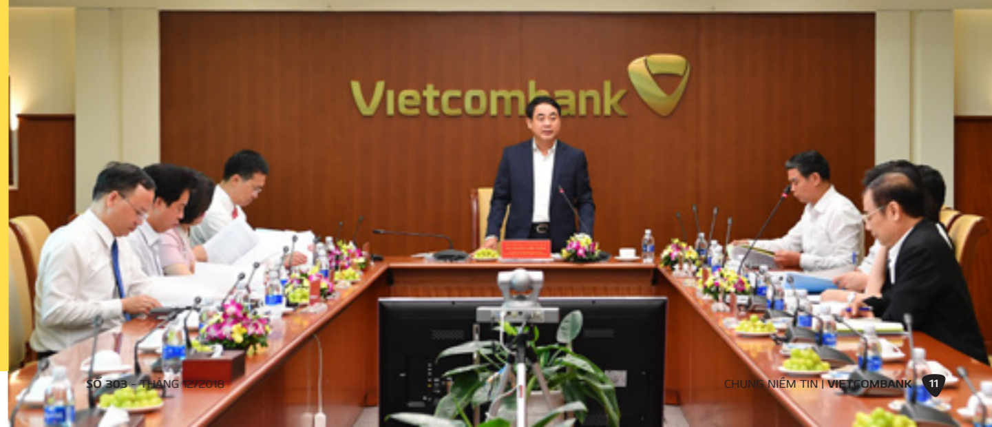
Đ/c Nghiêm Xuân Thành - Bí thư Đảng ủy, Chủ tịch HĐQT Vietcombank phát biểu tại Hội nghị BTV Đảng ủy phiên họp tháng 11/2018

Hội nghị đã lấy ý kiến góp ý của đại biểu cấp trên, ý kiến bổ sung của các Ủy viên BTV, tổng hợp và báo cáo Đảng ủy Khối Doanh nghiệp TW.