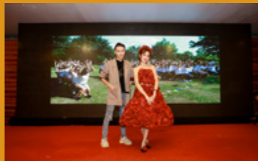
Thiết kế 999 đóa hồng (Bên phải)

sáng tạo từ khách hàng nhóm ngành Xây dựng. Tác phẩm được tái chế chủ yếu từ giấy, thép, tạo nên những kiến trúc tòa chung cư mái vòm rất bắt mắt.