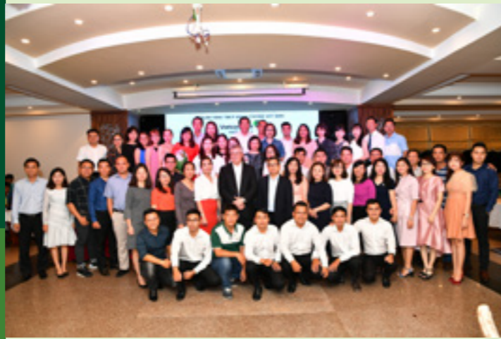
Lãnh đạo Vietcombank, VCLI cùng các tập thể và cá nhân đạt giải chụp hình lưu niệm